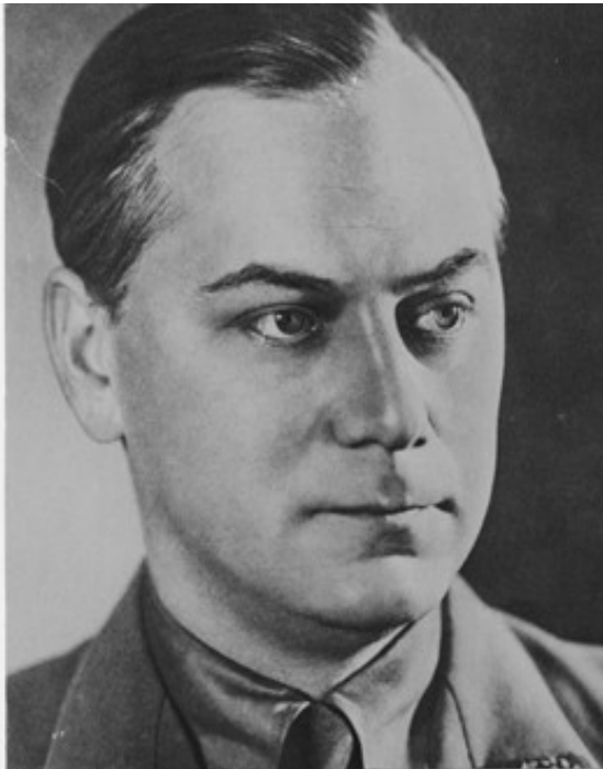
Alfred Rosenberg (condenado a muerte, tras la guerra, en los juicios de Nüremberg)

Una de las categorías básicas de su delirante “concepción del mundo” era la raza. La teoría racial del mediocre filósofo Alfred Rosenberg llegó a alcanzar la categoría de “antropología científica” cuando los nazis llegaron al poder. Sus tesis principales eran: